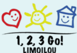
Table de mobilisation 1,2,3 Go! Limoilou

5 rencontres (comité de pilotage et mobilisation)